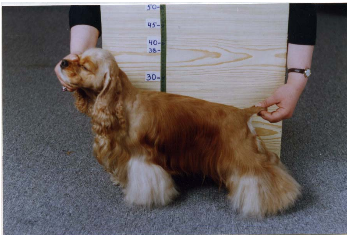
МАКЛАУД ШЕМИ (ВХ 28 см) вл. Плем. питомник «ШЕМИ»