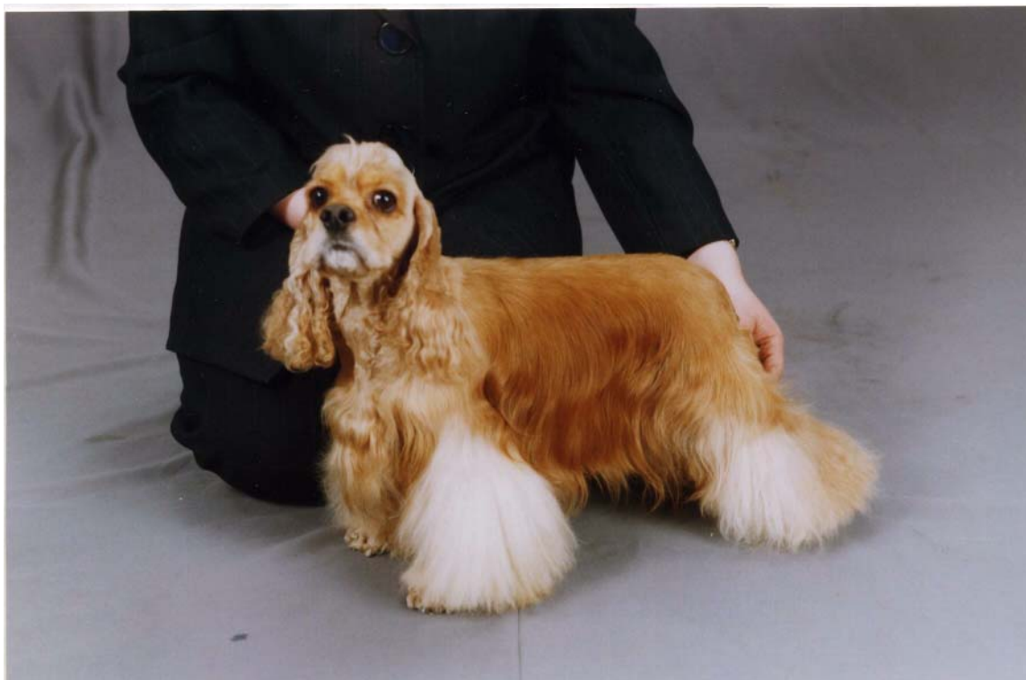
МАКЛАУД ШЕМИ вл. Плем. Питомник «ШЕМИ»